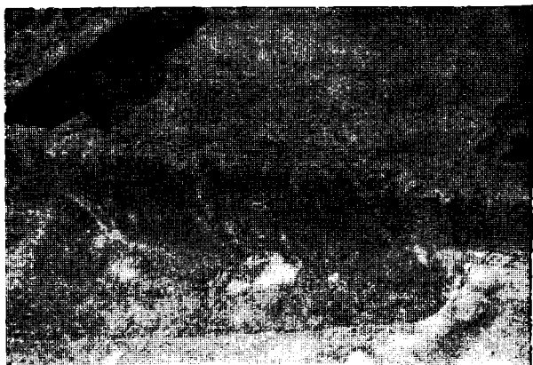
Fig. 1. Valea Timișului „Rovină“. Locuință hallstattiană.

S-a putut constata, astfel, că zona săpată reprezintă periferia sudică a așezărilor eneolitice și din epoca bronzului. Așezarea din prima epocă a fierului se continuă însă și aici, dovadă fiind descoperirea în secțiunile menționate a unei locuințe semiîngropate (L 3 Ha), de formă patrulateră cu colțurile rotunjite, a unui bordei de formă ovală (B 4 Ha) și a unei gropi (Gr. 2 Ha), toate aparținând acestei epoci. În S 10 , unde a mai fost încă surprins stratul de cultură al așezării din epoca bronzului, s-a putut reverifica existența a două niveluri de locuire în cadrul acestuia.